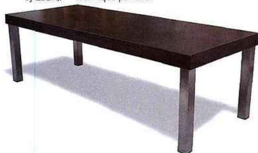
Table « Tellus » avec plateau en Béton Lége, 3 tailles, 16 couleurs, finition brute ou lisse résinée, choix de 4 piétements, 75 kg (à partir de 2990 €, Concrete Collection by LCDA).

PHOTOS: LA BÉTONNERIE, BÉTON & OBJETS, GALERIE 3 e RUE, LCDA - PORTRAIT MATALI CRASSET : GÉOFFROY COHENÉAU