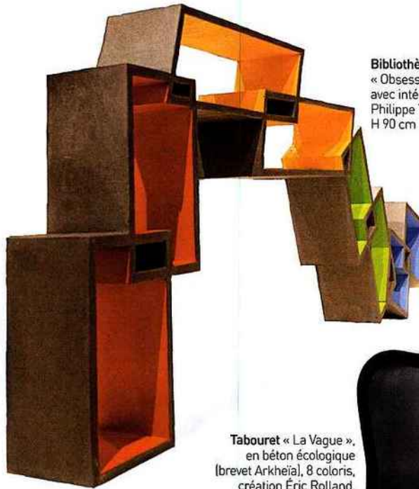
Bibliothèque déstructurée « Obsessions », en Ductal avec intérieur laqué, création Philippe Tissot, L 220 x P 25 x H 90 cm (8000 €, Taporo).