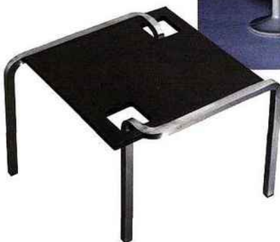
Table d'appoint en béton ultra-hautes performances et acier, création Mathilde Pénicaud, L 50 x l 50 x H 50 cm (2000 €, édition de 8 exemplaires, Galerie 3 e Rue, 2011).