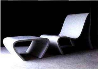
Fauteuil et table basse ou repose-pied « Spline », en Ductal de 2,5 cm d'épaisseur, coloris au choix, création David Rouyer, L 102 x l 60 x H 74 cm et L 63 x l 60 x H 33 cm (2 115 € les 2, La Bétonnerie).