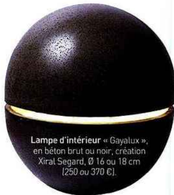
Lampe d'intérieur « Gayalux » , en béton brut ou noir, création Xiral Segard, Ø 16 ou 18 cm (250 ou 370 €).