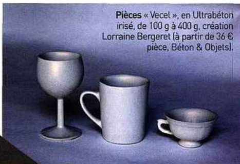
Pièces « Vecel » , en Ultrabéton irisé, de 100 g à 400 g, création Lorraine Bergeret (à partir de 36 € pièce, Béton & Objets).