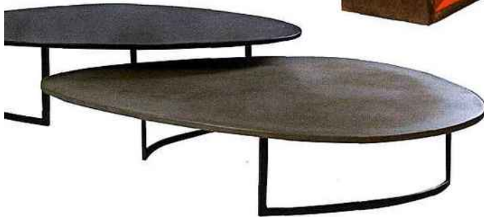
Tables basses « Galets » avec plateau en béton, de Salomé de Fontainieu, L 145 x l 125 x H 40 et L 125 x l 105 x H 30 cm (4 400 € pièce).