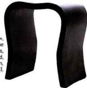
Tabouret « La Vague », en béton écologique (brevet Arkheïa), 8 coloris, création Éric Rolland, L 36 x P 27 x H 43 cm, 19 kg (à partir de 190€).